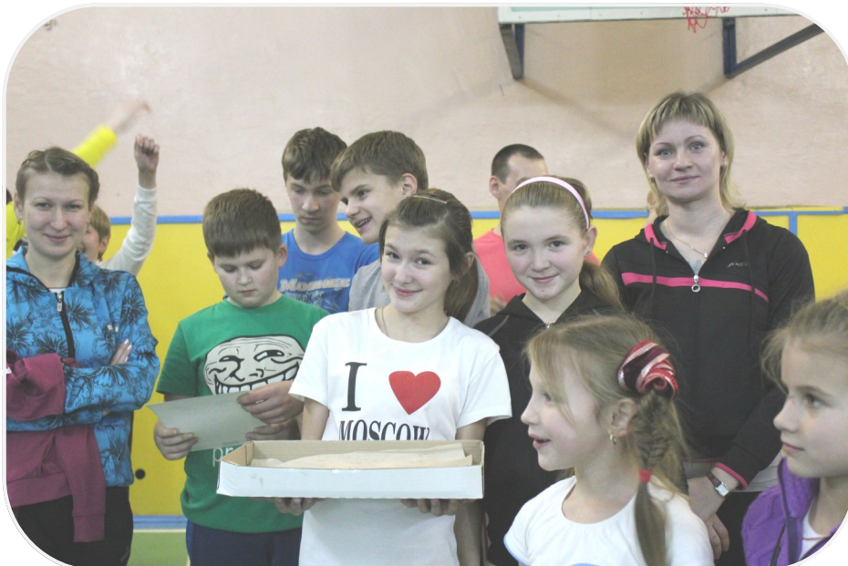
Фото из личного архива класса.